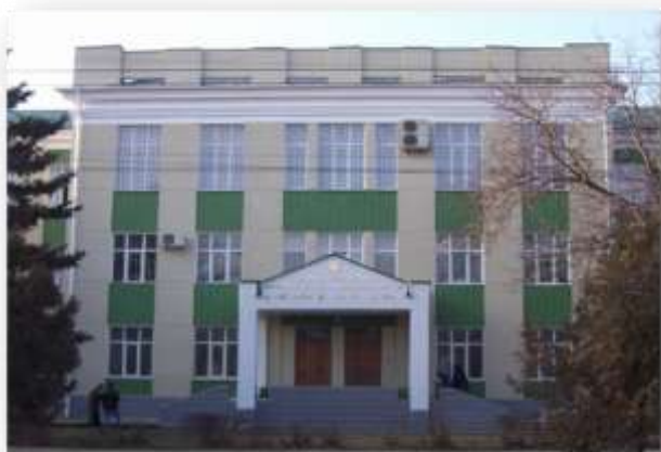
Сімферополь. Будівля Головного управління Державного казначейства України в АРК по вул. Севастопольській, 19