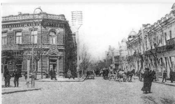
Сімферополь. Фрагмент вулиці Салгірної. Дореволюційне фото