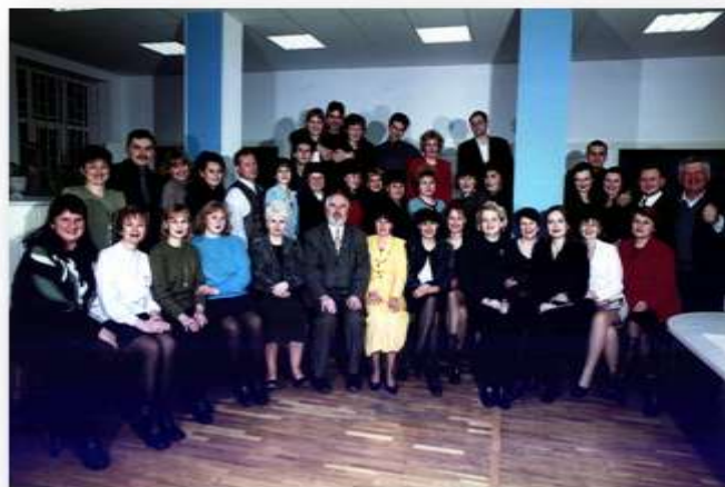
Сімферополь. Будівля УДК в АРК. Операційний зал. Колектив УДК в АРК, 2000 рік

З початку 2001 року для обліку виконання видаткової частини державного бюджету в органах Державного казначейства Автономної Республіки Крим була