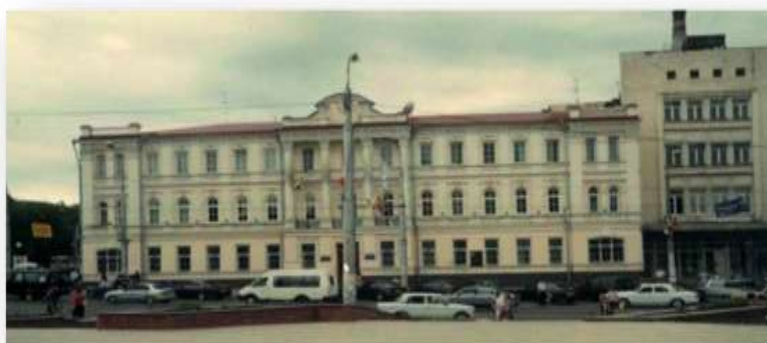
Сімферополь. ДАТ «Чорноморнафтогаз» (будівля колишньої Таврійської Казенної палати), 2005 рік