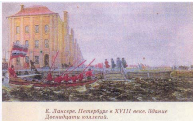
Е. Лансере. Петербург в XVIII веке. Здание Двенадцати коллегий.

У 1699 - 1701 р. при Петрі I була проведена реформа центрального управління. Накази були передані у ведення колегіального органу бурмістерської палати-Ратуші. Президент і члени (бурмістри) вибиралися купцями. У містах були створені виборні бурмістерські (земські) хати, які були підлеглі ратуші. У ратушу відійшли всі