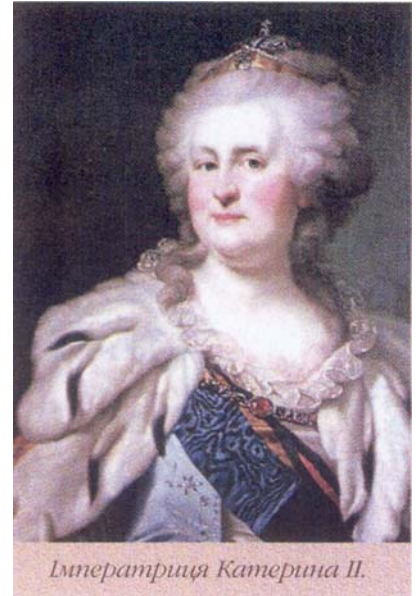
Імператриця Катерина II.

У 1797 році розпочалося формування нових відомств. Казначейські Експедиції Сенату були виведені з підпорядкування генерал-прокурора і