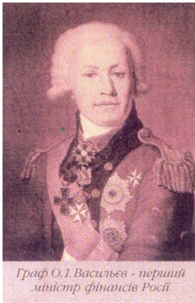
Граф О.І. Васильєв - перший міністр фінансів Росії

віддані під керівництво казначею графу А. І. Васильєву. Глава Комерц-колегії князь Гагарін почав іменуватися міністром.