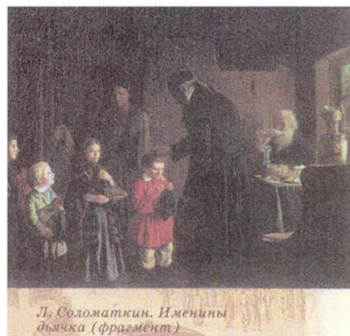
Л. Соломаткин. Именины дьячка (фрагмент)

Збором прямих і непрямих податків займався Наказ великого прибутку, його справи в 1680 р. були передані в Наказ великої казни. У його компетенції знаходився і грошовий двір, який розпоряджався карбуванням монет. На початку XVII століття була потрібна тверда влада на місцях. Основною ланкою місцевого управління стає воєвода, який мав наказову або «з'їздну» хату, де проводилися всі справи по управлінню. Наказова хата очолювалася дяком. Тут зберігалися державні грамоти і друк, прибуткові і витратні книги і розписи різних податей і зборів, самі збори (державна казна). У прибуткову хату зазвичай звозили всі зібрані гроші.