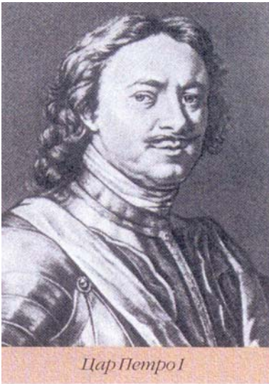
Цар Петро I

Перше положення про пенсії було видане Петром I в 1720 р. і діяло до 1827 року (107 років).