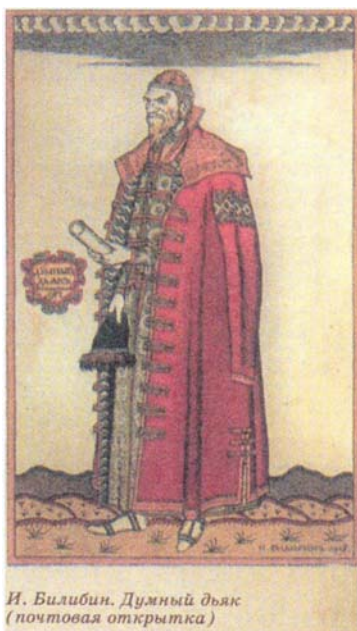
И. Вилибин. Думный дьяк (почтовая открытка)

Вже в 1450 р. вперше згадується казенний дяк, а в 1467 р. - казенний піддячий - посадові особи, що відають нескладним діловодством державної установи. Будучи головою найважливішого відомства, що склалося раніше інших, скарбник окрім основних функцій виконував і деякі інші загальнодержавні завдання: керуючи ямськими, помісними і хлопськими справами; діловодство по цих справах велося також на казенному дворі.